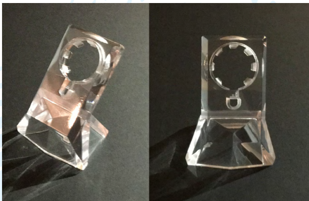
圖 1. Apple Watch 充電座架

本案 Apple Watch、iPhone、iPad 充電座架，以瑩新壓克力公司專業的厚實壓克力射出技術為基礎，進行一體成形之座架造型設計，同時結合透明壓克力材質晶瑩透亮之特性，完成本案三件「水晶款」充電座架產品；三件「水晶款」充電座架，皆以稜切面佈滿產品，但保持整體之簡約風格，創造出簡單、高雅的，符合潮流之充電座架產品。